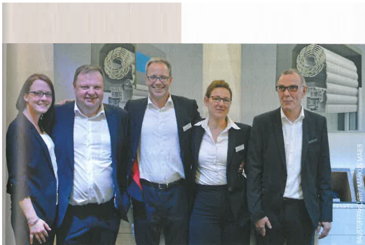
Sichtlich zufrieden mit dem Verlauf der Messe war das Team von Prix Systeme. Prix produziert moderne Rolladen- und Raffstorekästen als Einbau- und Aufsatzkästen. Das Baukastensystem bietet dabei höchste Flexibilität.