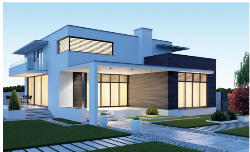
Die Öko Line umfasst hochwertige Rollladen- und Raffstoreelemente für nachhaltiges Bauen – ausgezeichnet vom Institut natureplus.

Um die Nachhaltigkeit der Öko Line Kastensysteme unter Beweis zu stellen, haben sie das aufwändige