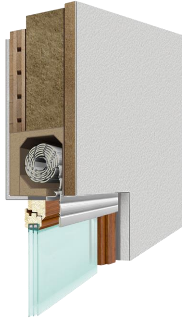
Einbausituation: PRIX Einbaukasten aus der Öko-Line im Holzhaus