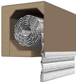
PRIX Einbaukasten aus der Öko-Line